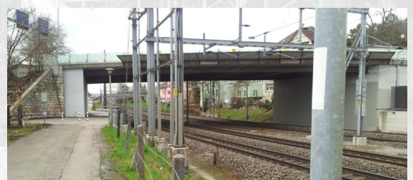
Deterministische Anpralluntersuchung gemäss AB-EBV, Anhang 1, Überführung Römerstrasse, Winterthur